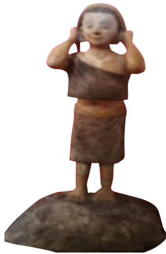
ပုံ။ ( ခ ) လက်ရှိမြို့လူမျိုးတို့တွင် ရှိသော မြောက်ဦးခေတ် မြို့လူမျိုးတို့ ၏ ဝတ်စား ဆင်ယင်ပုံ ကျောက်ရုပ်ထု။ အရွယ်အစား ၇ လက်မခန့်ရှိသည်။