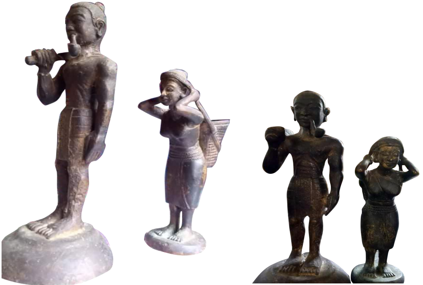
ပုံ။ ( က ) လက်ရှိမြို့လူမျိုးတို့ တွင် ရှိသော မြောက်ဦး ခေတ်၊ ဝတ်စားဆင်ယင်ပုံ မြို့လူမျိုး ကြေးရုပ်ထုတ်ပြား အရွယ်အစားမှာ အမျိုးသားရုပ်ထု ( ၆.၅ လက်မ ) ၊ အမျိုးသမီးရုပ်ထု( ၅ လက်မ )